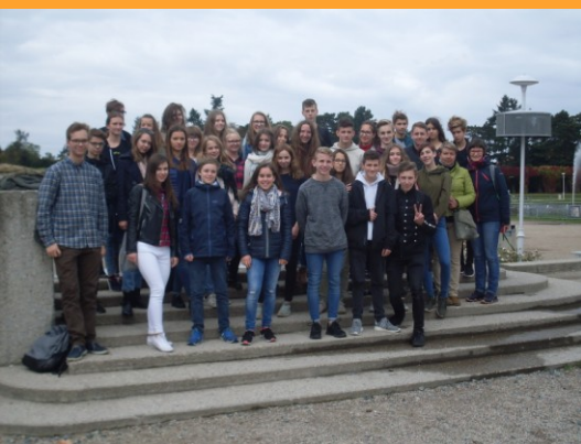
Austauschfahrt der 9. Klasse nach Polen