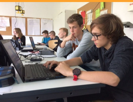
Projektarbeit der 9. Klassen zum Thema "News Caching"