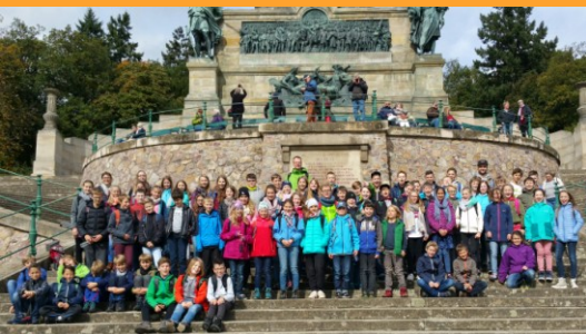
Klassenfahrt der 6. Klassen nach Wiesbaden