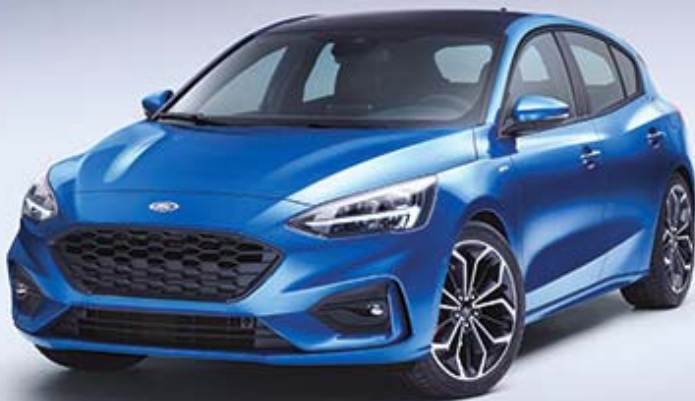
Abbildung zeigt Warenausstattung gegen Mehrpreis.