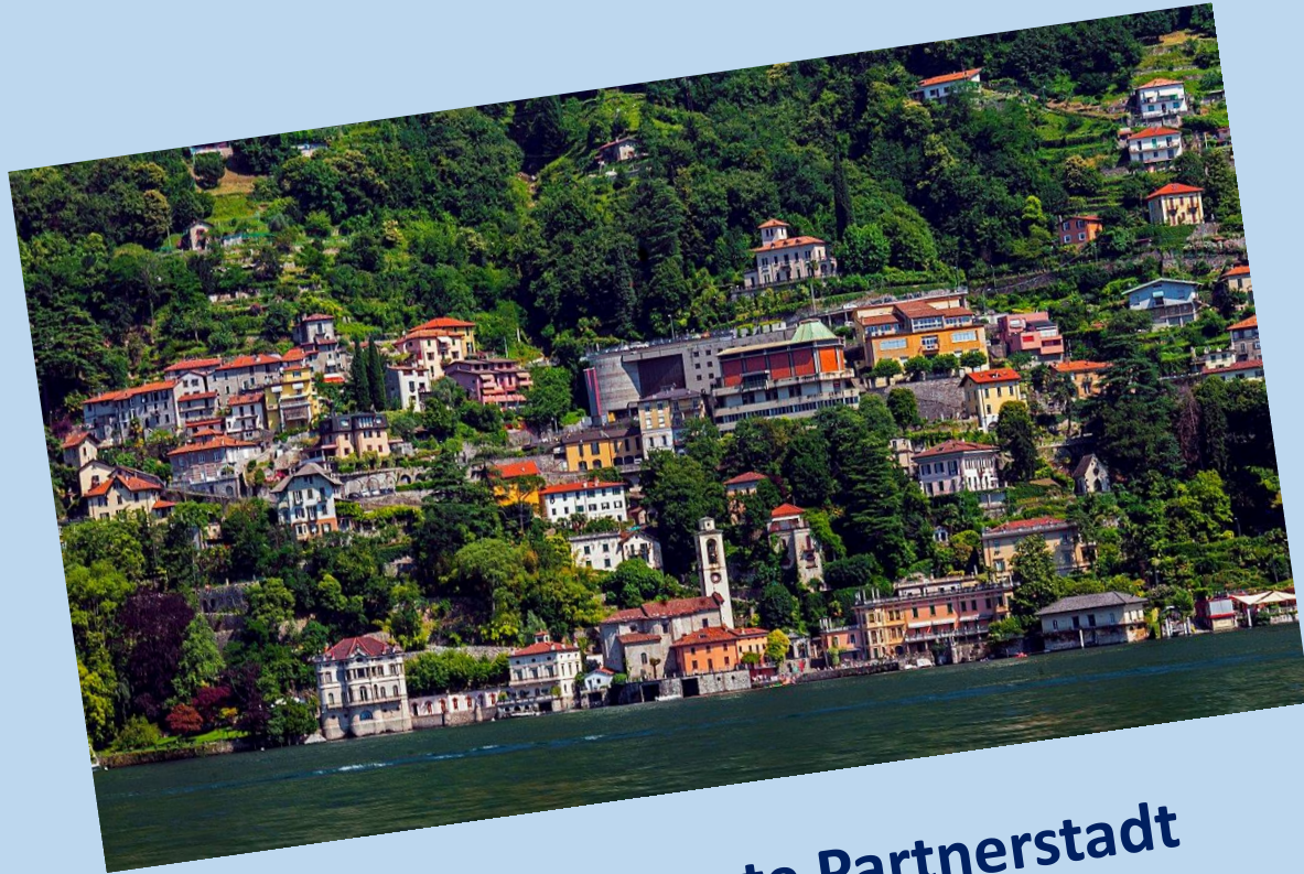
Como, Fuldas erste Partnerstadt