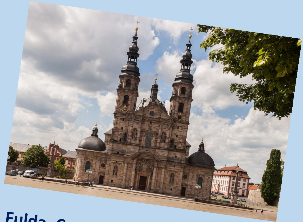
Fulda, Comos erste Partnerstadt